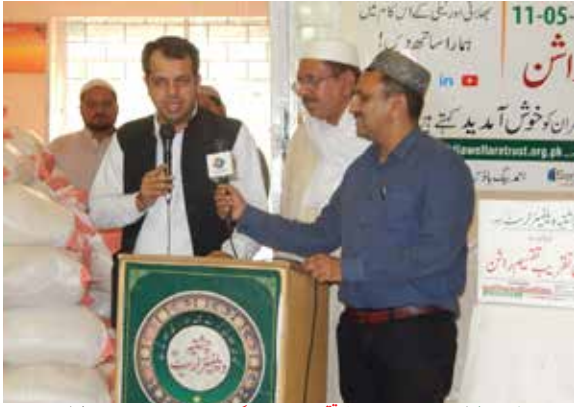
چشمیہ ویلفیئر سوسائٹی کی جانب سے سالانہ رمضان راشن تقسیم تقریب میں ڈپٹی کمشنر لاہور سمیر احمد سید صاحب نے سوسائٹی کی بہترین کارکردگی پر مبارکباد پیش کی اور اس تقریب میں انہیں خصوصی عہد سے مبارکباد کر کے سوسائٹی کے اہل کاروں کو مبارکباد دے کر ان کے کاموں کو سراہا۔