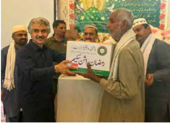
چشتیہ ویلفیئر سوسائٹی کی جانب سے سالانہ رمضان راشن تقسیم تقریب میں صوبائی وزیر صنعت و تجارت میاں اسلم اقبال صاحب ہمدرد افراد میں راشن تقسیم کر رہے ہیں۔