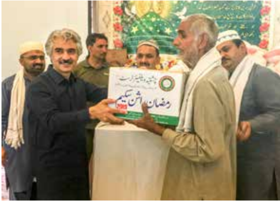
چشتیہ ویلفیئر سوسائٹی کی جانب سے سالانہ رمضان راشن تقسیم تقریب میں صوبائی وزیر صنعت و تجارت میاں اسلم اقبال صاحب ہمدرد افراد میں راشن تقسیم کر رہے ہیں۔