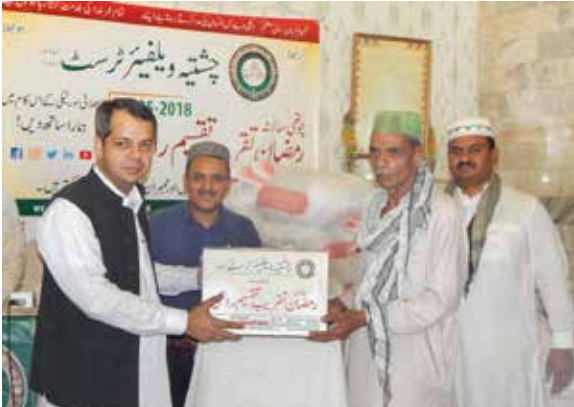
چشمیہ ویلفیئر سوسائٹی کی جانب سے سالانہ رمضان راشن تقسیم تقریب میں ڈپٹی کمشنر لاہور سمیر احمد سید صاحب ہمدرد افراد میں راشن تقسیم کر رہے ہیں۔